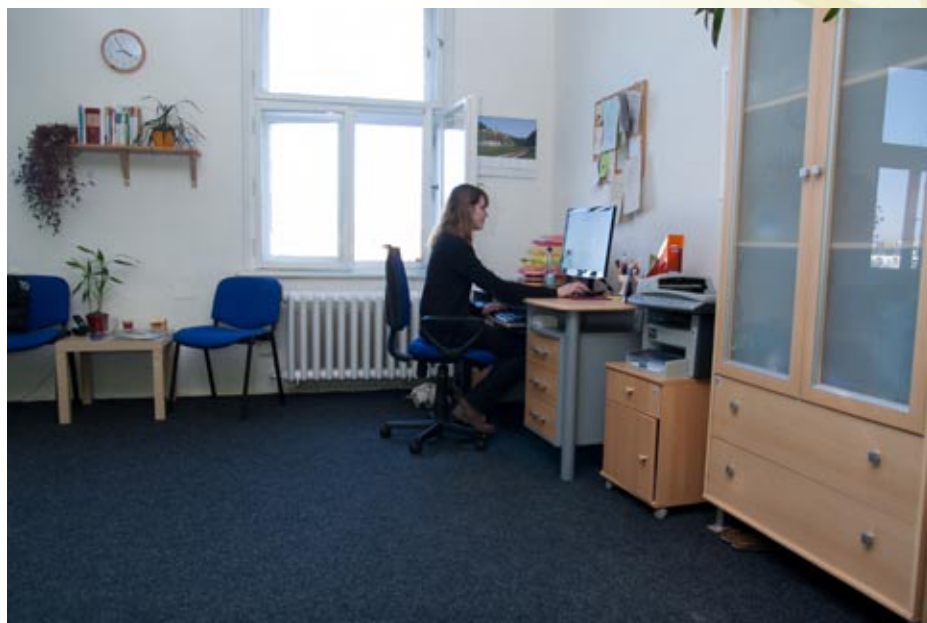
Centrum poradenství a prevence